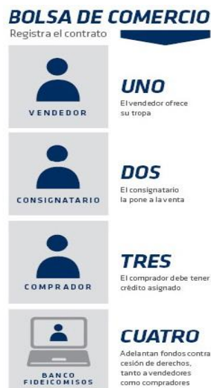
Figura 2: Procedimiento online ROSGAN